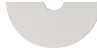
Белый перламутровый (White pearl)