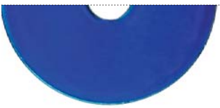
Морской синий (Dormant marine blue)