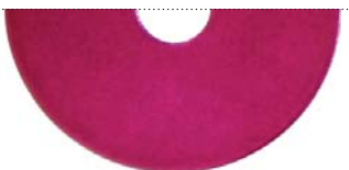
Малиновый перламутровый (Dormant Vinho Sparkle)