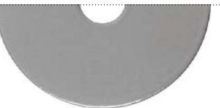
Серебряный бриллиант (Brilliant silver)