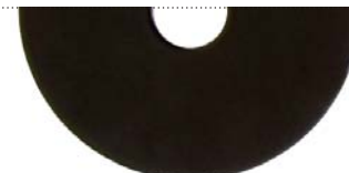
Черный (Jet black RAL 9005)