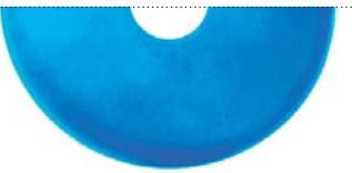
Синий металлик (Pure metal blue)