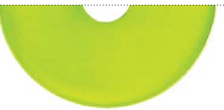
Зеленый металлик (Pure metal green)