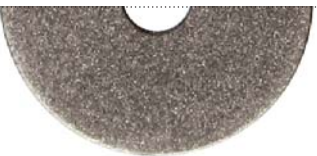
Антрацит металлик (Anthracite metallic)