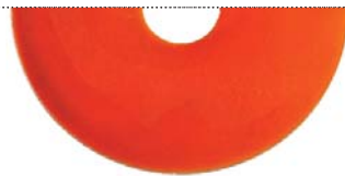
Бронзовый металлик (Pure metal bronze)