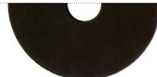
Черный матовый (Deep black matte)