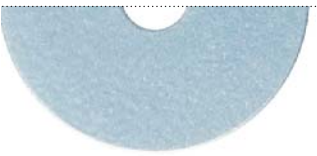
Серо-голубой (Ice blue)